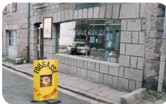
Un authentique artisan boulanger a pénétré le rayon viennoiserie d'une grande surface - Chez M. Vigouroux à Saint Urcize, Cantal

Biscuiterie et chocolaterie sont des fabrications plus facilement envisageables pour la revente. Leur conservation, généralement supérieure à deux mois autorise un rythme de production discontinu. Ces conditions de travail conviennent particulièrement aux petites structures rurales qui ont des pointes de travail l'été et ne savent pas comment rentabiliser le personnel en hiver.