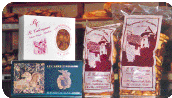
Le conditionnement protège le produit et informe le consommateur Chez M. Calvagnac à Anglard de Salers (Cantal)

Si le travail leur en laisse le temps, les boulangers peuvent également participer aux petits marchés locaux qui font généralement la promotion des produits du terroir ou des produits artisanaux de qualité (environ 300 F la place pour le week-end).