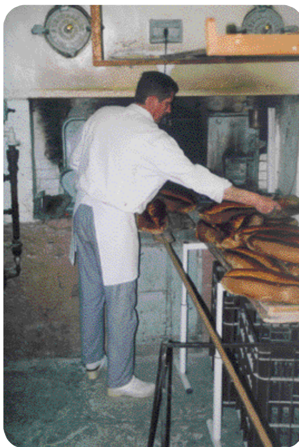
Chez M. Guardiola, la qualité du rayon fruits et légumes est à l'image de son pain sur levain cuit au feu de bois

La clientèle locale n'est pas la seule à profiter de ce rayon : une nouvelle clientèle de passage s'approvisionne maintenant au magasin.